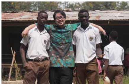
写真が好きな生徒と一緒に。 来ている服は、アフリカ布のオーダーメイドです。

私は今、アフリカはガーナのアシャンティ州フォメナにあるFomena T.I Ahmadiyya 高校にて理科の先生として活動しています。JICA ボランティアとしては3代目の派遣となっています。活動目的としては、実験を取り入れた授業の展開が主となり、全員が教科書を持っておらず知識の詰め込みが主流の中で、いかに生徒の理解を助ける実験授業、視覚教材などが重要であるかを、先生と生徒に対して広めていきたいと考えています。