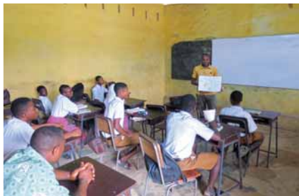
自分が用意したイラストや実験などを現地の先生に実際に使ってもらうことで、先生方の理解も得られるよう活動を行っています。